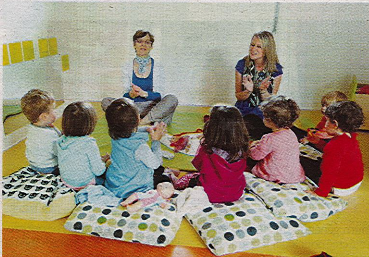
Environ 550 places en crèche sont proposées sur Pessac. C'est mieux que chez pas mal de voisins aquitains.

L'accueil se fait dans la plupart des cas hors des vacances solaires et jours fériés.